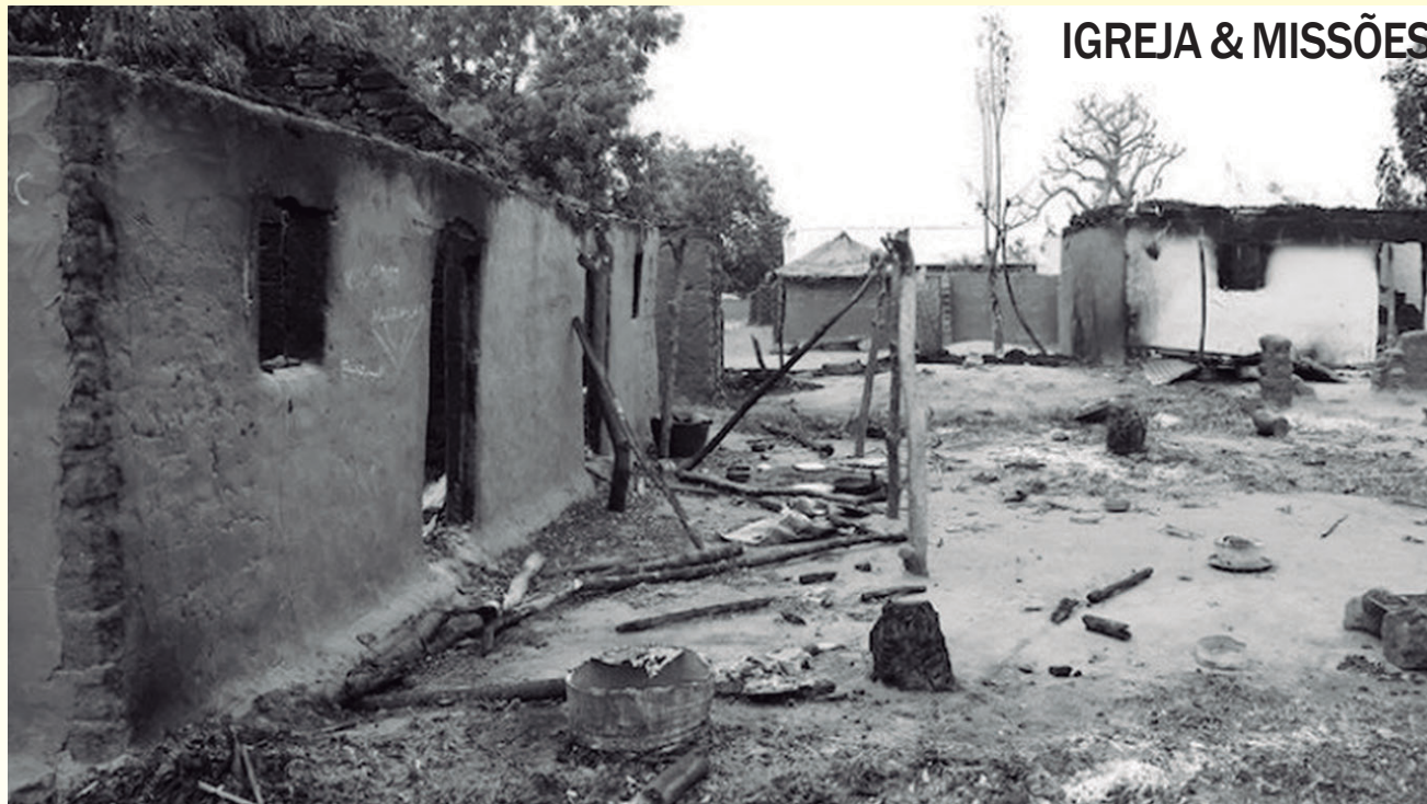
As ruínas da escola, destruída pelo incêndio causado pelos terroristas