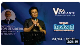
Noite de Quarta | 21º Congresso Vida Radiante | 24/04/24