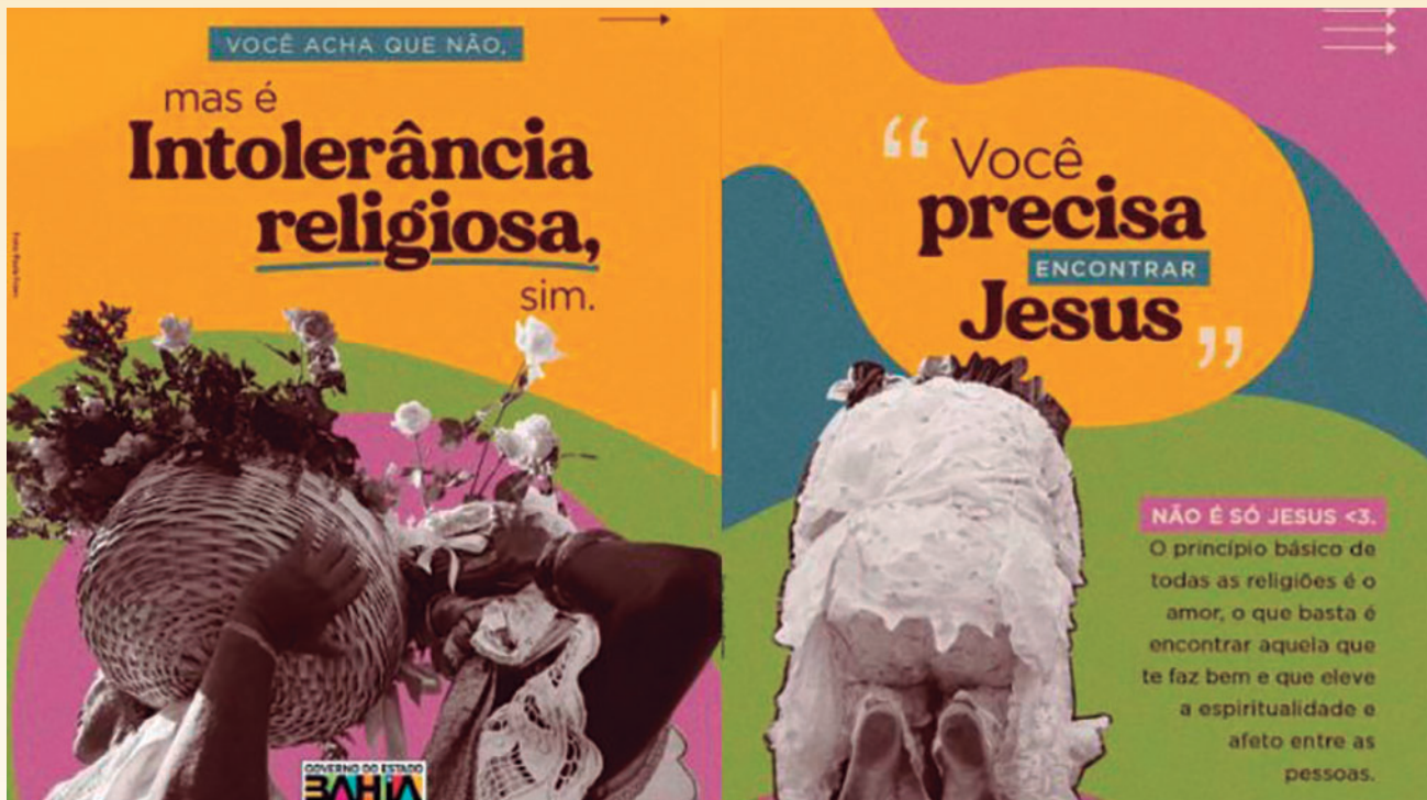
Publicação do Governo da Bahia