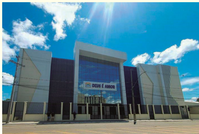
A nova sede da IPDA em Porto Alegre

“As enchentes que afligiram Porto Alegre e o Rio Grande do Sul representaram momentos de extrema dificuldade para todos, incluindo a IPDA. Ao mesmo tempo foi um período de união cujo foco foi ajudar as pessoas mais necessitadas. Estamos certos de que saímos fortalecidos após esse episódio. A reabertura da igreja simboliza esse novo momento, só alcançado pelas graças de Deus. Por isso convidamos a todos a conhecer a nossa