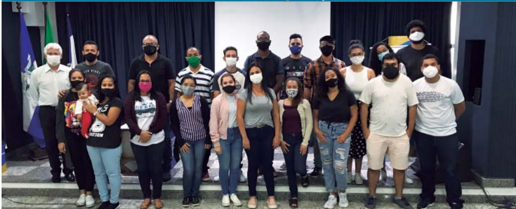
O GRUPO DE PARTICIPANTES do Curso Geração Conectada prontos para enfrentar os desafios da realização de um ministério relevante, consistente e saudável